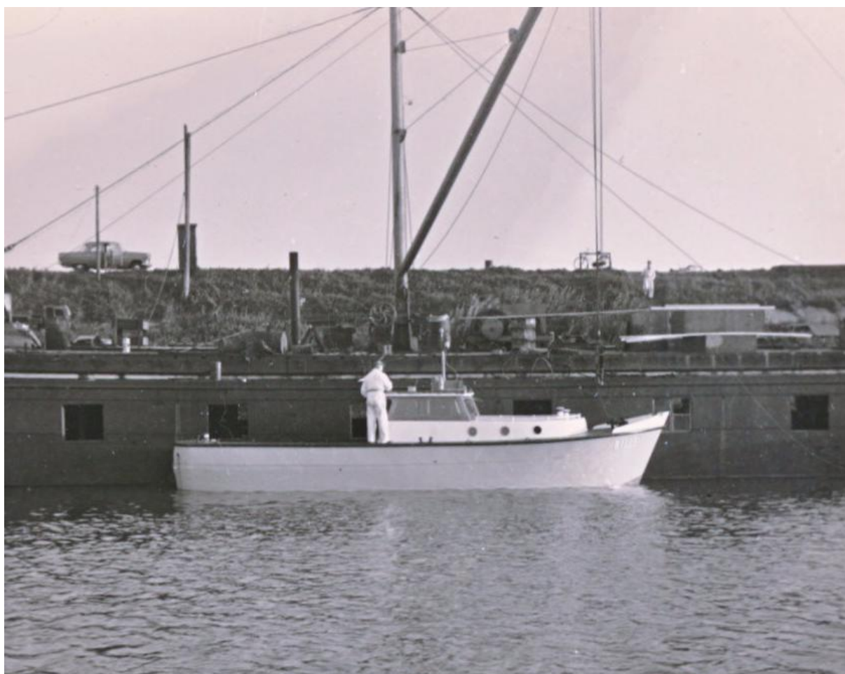
Schilder legt de laatste hand op de Billet, liggend voor het werkschip "Metallurgica"