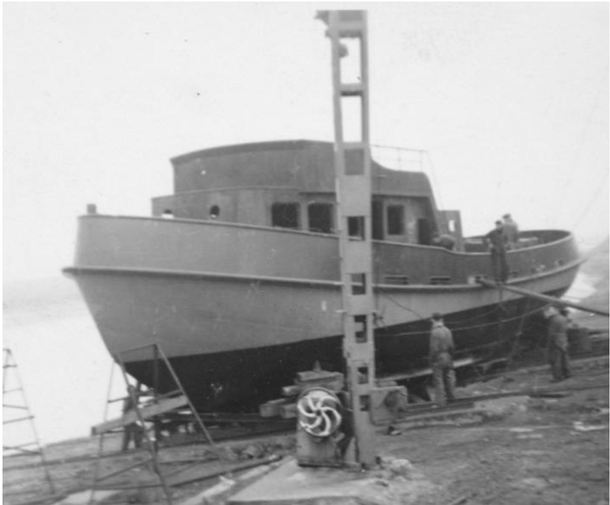
Casco van de riviersleepboot "Albert II" bijna gereed op de helling aan de Dijk.