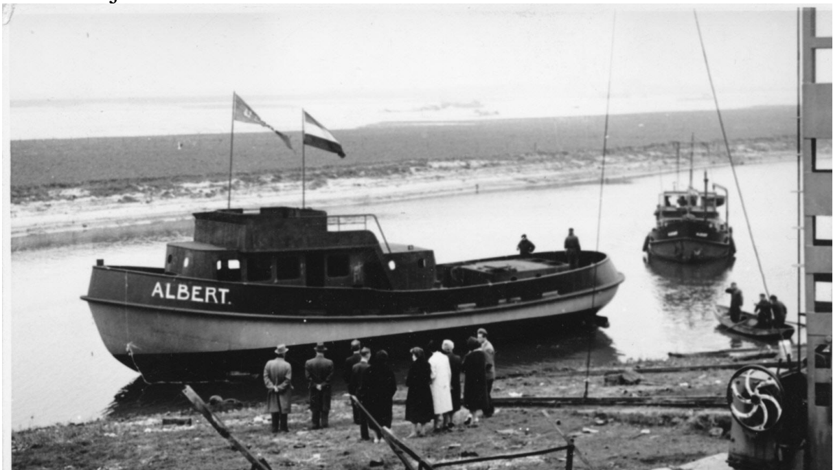
De "Albert II" kort na de tewaterlating ± 1962