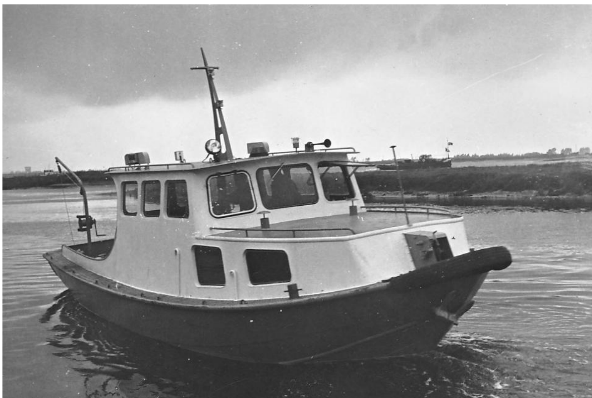
Het is duidelijk een sleepvlet maar van wie? Opvallend is de zware opbouw.