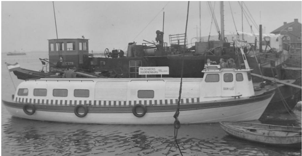
De parlevinkerboot "Dor Lei" van Thé Scheers uit Doornenburg gereed, liggend achter het werkschip "Matallurgica" in 1961. Met de eigenaren achter de stuurhut?