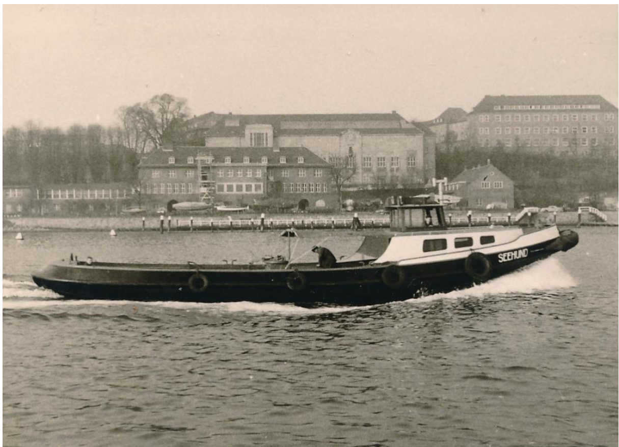
De “Seehund” in de haven van Kiel.