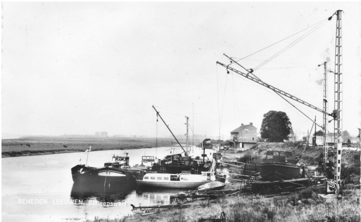
Helling met op de voorgrond een bedrijfsvaartuig in aanbouw. De pas gereed zijnde 'Dor Lei' van Thé Scheers en enkele aange- meerde schepen. De kranen staan op de helling en op het werkschip.