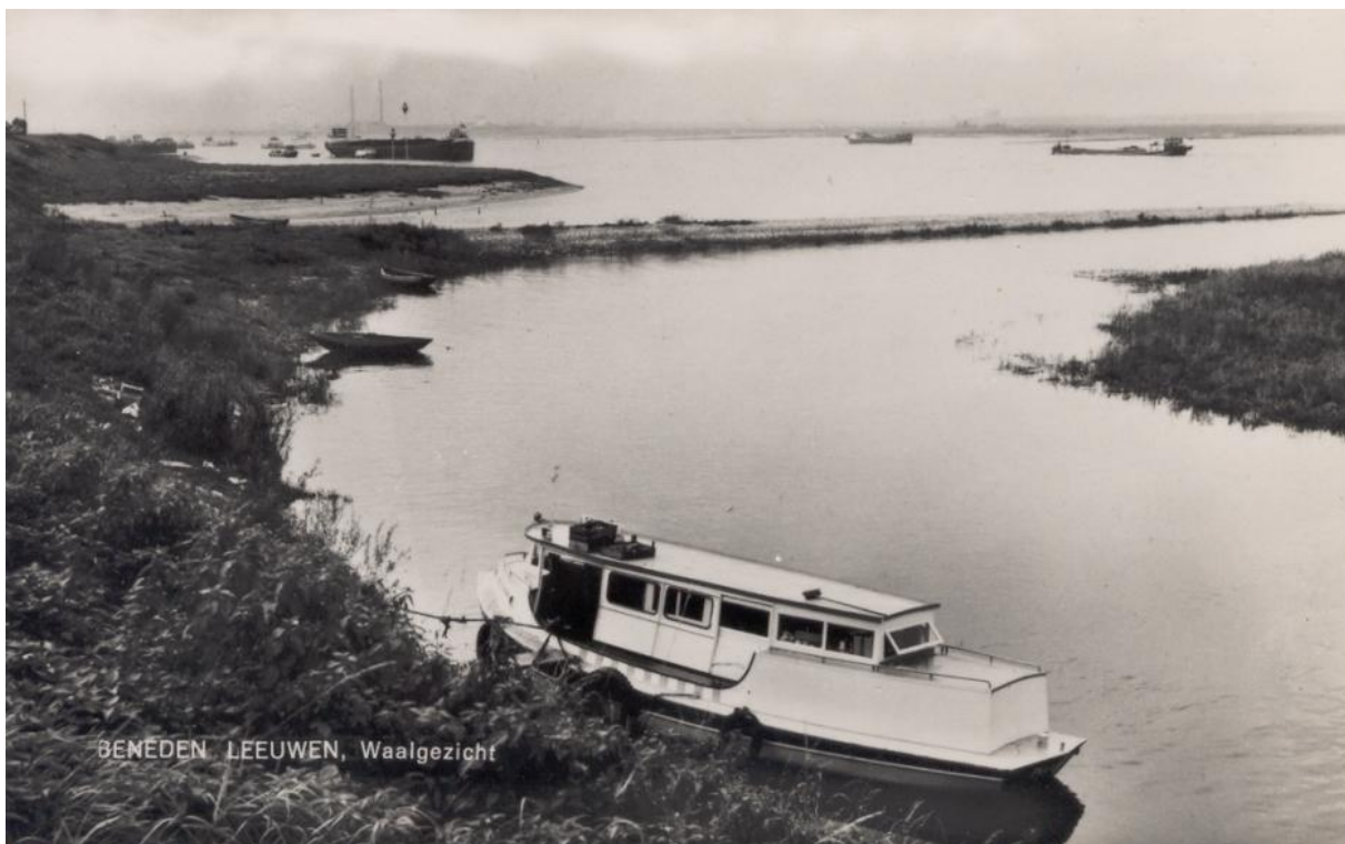
Proviandboot "Pelikaan" van Frans Toebast (de oude), afgemeerd tegenover zijn café "De Pelikaan". Op de open oudere boot is in 1959 deze overdekte opbouw gemaakt.