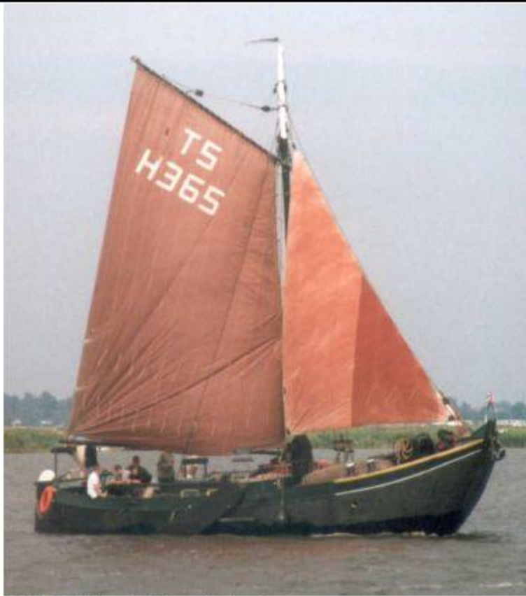
Dit is de 'Goliath' (ex Hanjo, ex Anthonius), 15 x 5,2 x 1,2m, 35 ton, gebouwd in 1930 bij Gebr. Eltink te Beneden-Leeuwen.

Zeilende schokker zoals die in het begin van de 20e eeuw nog veel gebruikt werden voor de visvangst en bewoning op de Maas en de Waal. Het is een stalen, geklonken schip met houten zijwaarden en een zware ankerlier op het voordek. Waarschijnlijk nog zonder motor. Het linnen grootzeil heeft een losse broek (onderlijk) met reefknuttels en een gaffel. Weet iemand nog iets van de eerste eigenaars van dit schip? Ik denk daarbij ook aan een legendarisch bootmens als Arie Schiffart.