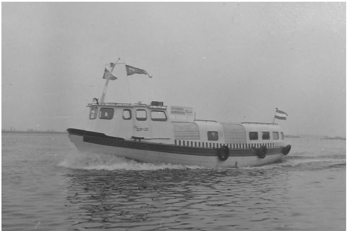
De "Dor Lei" op de Waal.