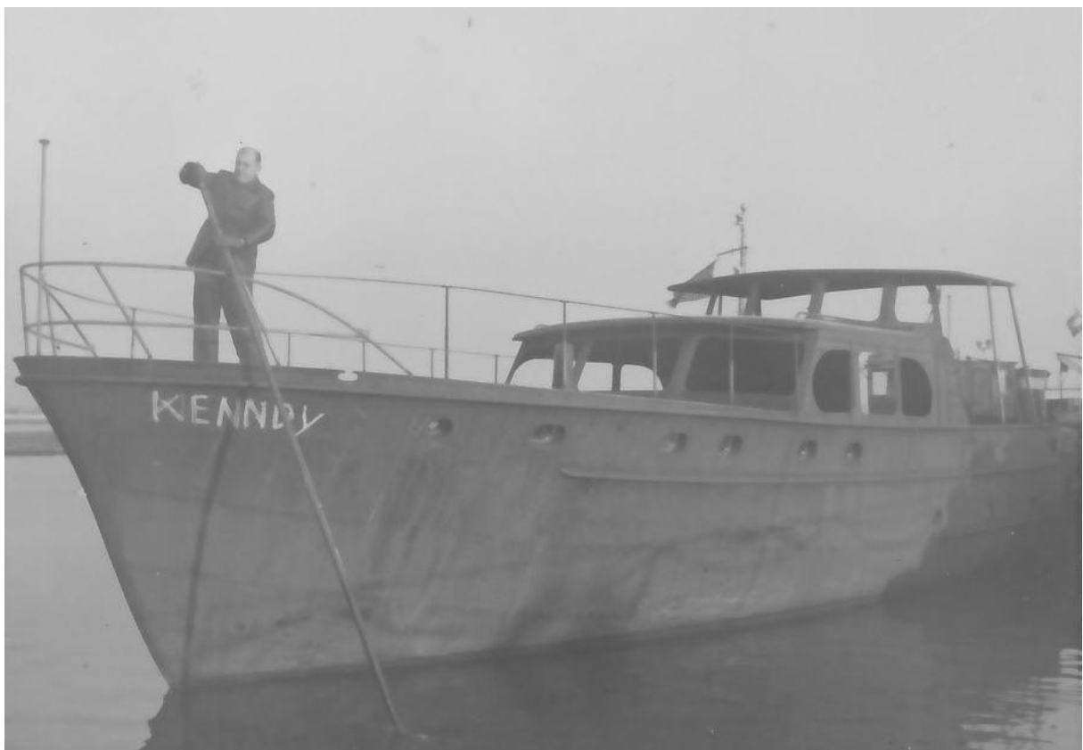
± 1962 Een van de casco's, gebouwd in opdracht van Jachtbouw Van Lent. Deze is nog aan de Strang gebouwd en later in de Kaag verder afgebouwd voor Amerikaanse rekening. John Kennedy was toen president, vandaar de naam!