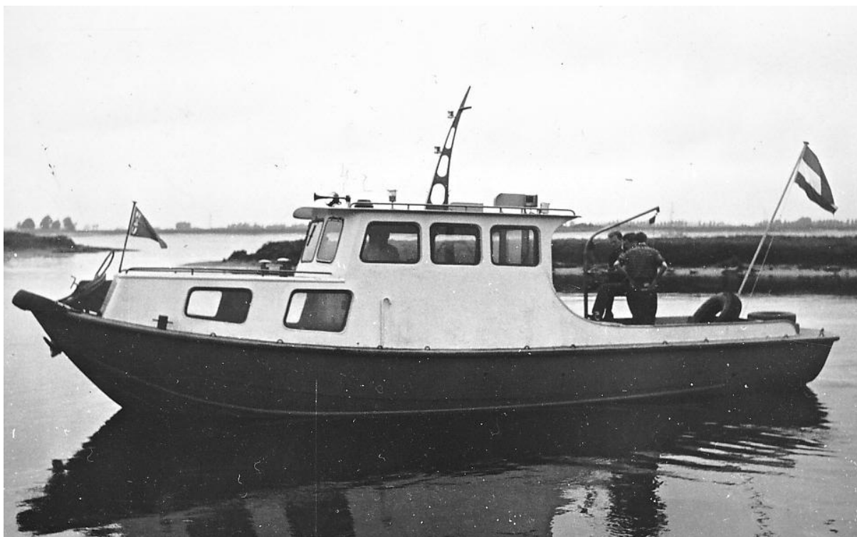
Alleen de naam "Flevo" gevonden.